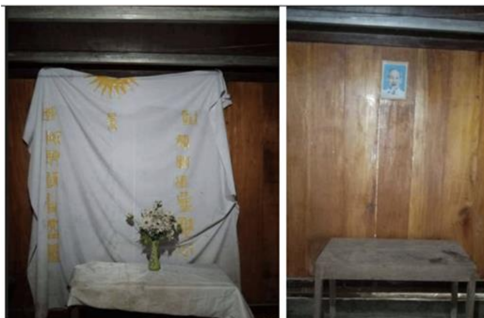
Bàn thờ tại nhà người dân theo đạo Dương Văn Minh (trái) và sau khi bị công an đột nhập vào nhà để dỡ bỏ trong năm 2022