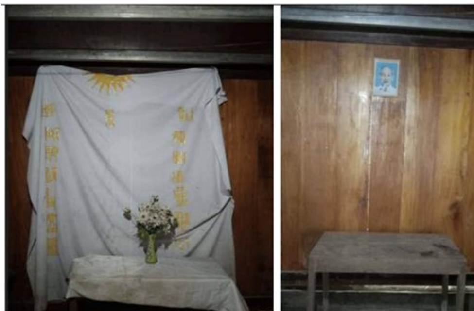
Bàn thờ tại nhà người dân theo đạo Dương Văn Minh (trái) và sau khi bị công an đột nhập vào nhà để dỡ bỏ trong năm 2022