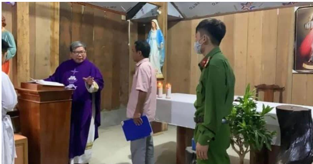
Chính quyền xã Đắc Nông ngăn cản thánh lễ ở Giáo họ Phaolo ngày 22/3/2023