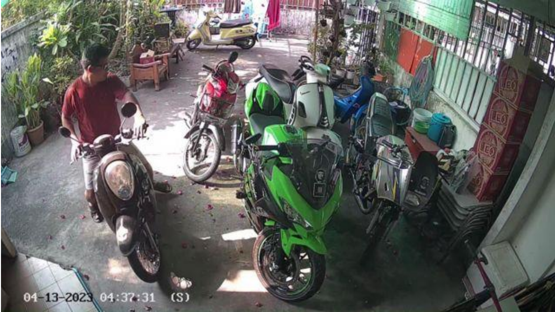
Một trong những hình ảnh cuối cùng của ông Thái trước khi bị bắt tích vào ngày 13/4/2023

Blogger Đường Văn Thái là một người bất đồng chính kiến nổi tiếng trên mạng xã hội và là một nhà báo công dân với nhiều thông tin và bài phân tích sâu về nghị trường Việt Nam. Do những đàn áp ở Việt Nam, ông Thái đã phải sang Thái Lan từ năm 2019 và được Cao uỷ LHQ về người tị nạn cấp quy chế tị nạn vào tháng 7/2020.